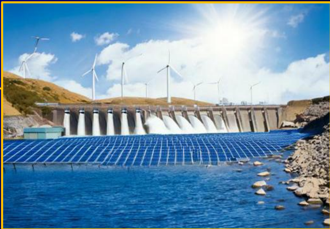
Imagem criada com Inteligência Artificial.